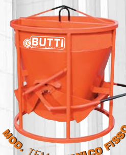
MOD. TEM - MANICO FISSO