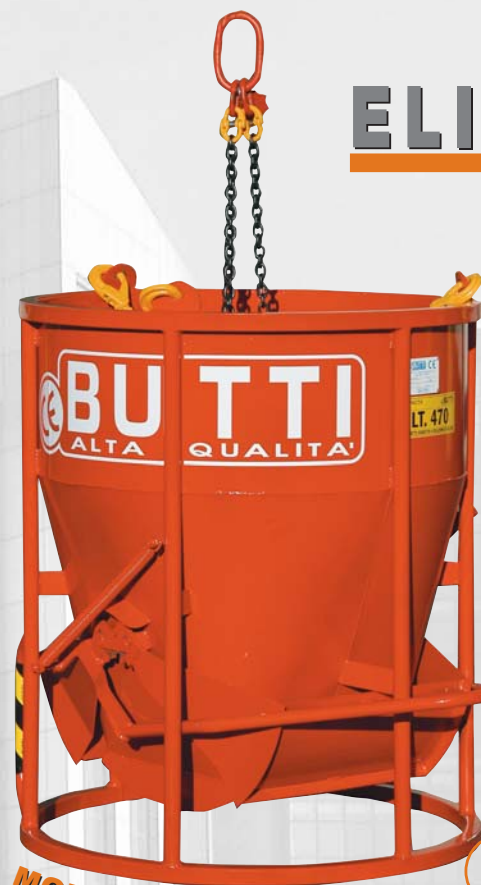
MOD. TEC - CON CATENA